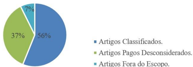
Figura 2 – Gráfico de porcentagem de artigos considerados ou não nesse estudo.

desconsiderados 37% (n = 15) dos artigos, em razão de serem pagos e 7% (n = 3) dos artigos, por estarem fora do escopo do estudo.