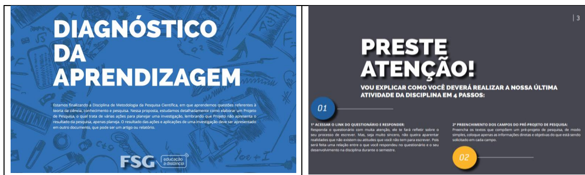
Figura 1: PDF interativo – Diagnóstico da Aprendizagem

Observe na figura 1 algumas etapas da ferramenta Diagnóstica da Aprendizagem.