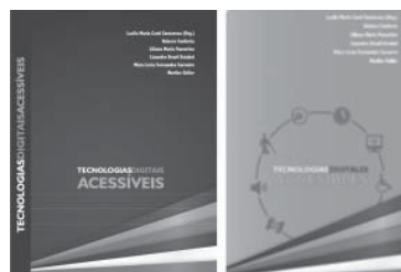
FIGURA 2 – Tecnologias Digitais Acessíveis e Tecnologías Digitales Accesibles, Material Didático Impresso do Curso.

mediadas por formadores e tutores que dominam a língua espanhola. A partir de 2011, os professores-cursistas de língua espanhola terão acesso a essa publicação na versão em espanhol, Tecnologías Digitales Accesibles (Figura 2), beneficiando educadores de países ibero-americanos como Argentina, Uruguai, Chile, Colômbia, Panamá, Costa Rica, México, El Salvador e Espanha.