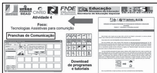
FIGURA 7 – Atividade 4: Tecnologias Assistivas Para Comunicação

com déficit na comunicação, uma intervenção que muitas vezes se faz necessária junto a alunos com paralisia cerebral.