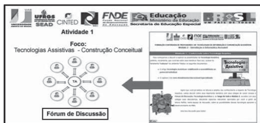
FIGURA 3 – Atividade 1: Tecnologias Assistivas, Construção Conceitual

Na atividade 1 , os professores-cursistas são apresentados e convidados à leitura de um conjunto de documentos, muitos deles disponíveis no Portal do MEC, para a apropriação conceitual da Tecnologia Assistiva (Figura 3). Essa atividade abre o módulo do curso com o objetivo de aproximação do professor-cursista com o campo de saber da Tecnologia Assistiva, para apropriação do conceito, da categoria e de sua aplicabilidade a fim de mediar interações da diversidade humana com o contexto sociocultural.