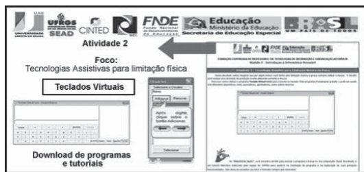
FIGURA 4 – Atividade 2: Tecnologias Assistivas Para Limitação Física.

professor, para que o mesmo possa continuar a explorar esses recursos, para garantir e qualificar o processo de mediação das estratégias de aprendizagem junto a alunos com necessidades especiais.