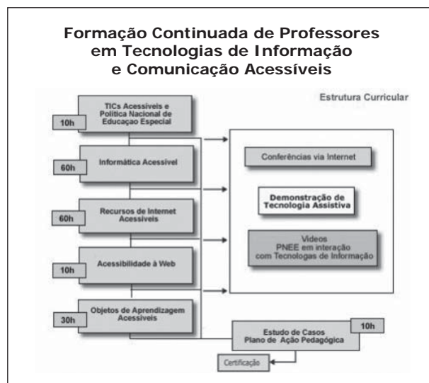
FIGURA 1 – Estrutura Curricular do Curso

A opção metodológica do curso centra-se na interação de seus participantes – professores, formadores, tutores, coordenador – para edificar uma verdadeira comunidade virtual de aprendizagem. Esse curso tem a duração de 180 horas e apresenta a seguinte estrutura curricular (Figura 1):