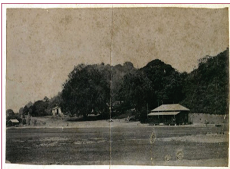
Figura 2 - Sede do Rio Cricket Club