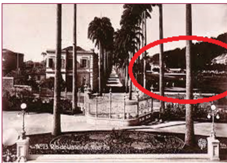
Figura 1 - Rua Paissandu vista de dentro do Palácio Guanabara. À direita, a sede do clube.