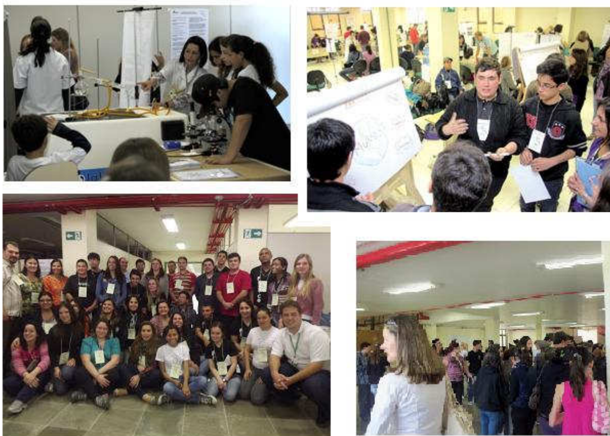
Figura 2 – Imagens da II Feira de Ciências do Campus Bagé.

A participação dos alunos e professores da educação básica superou nossas expectativas, nos motivando ainda mais a dar continuidade ao projeto que apresenta potencial para se tornar uma atividade permanente do campus Bagé. Para o próximo ano investiremos em uma maior divulgação para motivar a participação de mais escolas e procuraremos promover encontros com professores durante o ano de 2013, visando propiciar uma maior preparação para a feira e, conseqüentemente, melhorar a qualidade dos trabalhos.