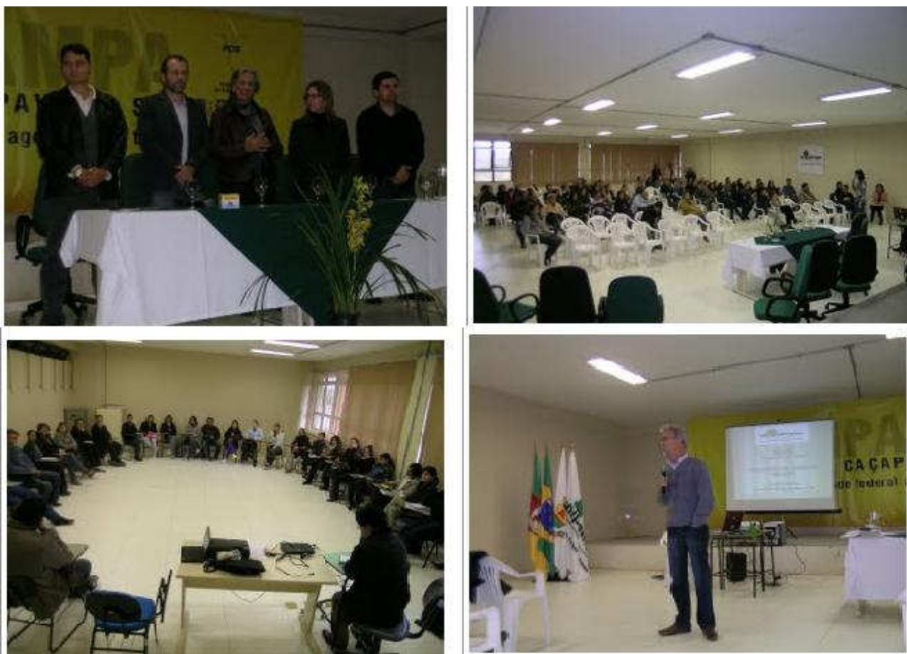
Figura 1 – Encontro inaugural em Caçapava do Sul.

Durante o planejamento dos oito encontros* presenciais se estabeleceu uma forte interação com os membros da equipe executora, principalmente por envolver dois campi da UNIPAMPA. Procurou-se estabelecer dinâmicas semelhantes, mas respeitando as peculiaridades de cada campus. Nos encontros foram discutidos principalmente: metodologia de projetos, interdisciplinaridade e uso de mapas conceituais. Realizamos rodadas de projetos envolvendo temas da região: asfalto, mate, calcário, carvão, microclima, fronteira, pampa, mel e lã. A seguir algumas fotos dos encontros. Na Figura 1 apresentamos imagens da nossa atividade inaugural.