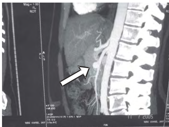
Figura 1. Aneurisma de artéria mesentérica superior, visto no perfil em angiotomografia.

Aneurismas são definidos como um aumento localizado de uma artéria maior que uma vez e meia seu diâmetro esperado naquela região. Os aneurismas podem ocorrer em qualquer local da árvore arterial, mas são mais comumente encontrados na seguinte ordem decrescente de frequência: aorta, ilíacas, poplíteas e femorais (1). As demais artérias, como as carótidas, renais, viscerais e as das extremidades superiores, raramente são acometidas (1). Os aneurismas de artérias viscerais são encontrados em somente 0,2% da população em geral. Entre eles, os aneurismas de artéria esplênica são os mais frequentes, e os aneurismas de artéria mesentérica superior (AMS) (figura 1) são muito incomuns, perfazendo apenas 5,5 a 8% dos aneurismas viscerais (2) e menos de 0,5% de todos os aneurismas intra-abdominais (3).