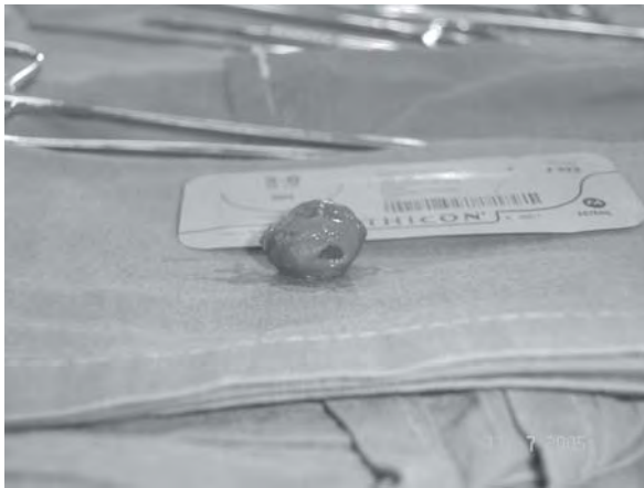
Figura 3. Aneurisma sacular com aproximadamente 3 cm de diâmetro.

terações, pulsos periféricos 4+/4+, simétricos. Em vista dos achados angiotomográficos, foi estabelecido o plano de correção cirúrgica do aneurisma. No intra-operatório, foi dissecada a artéria mesentérica superior junto ao seu óstio, sem identificação de aneurisma, prosseguindo-se com dissecação da artéria ao longo de seu trajeto, onde se identificou um aneurisma sacular (figura 3) no segmento médio-distal, com aproximadamente 3 cm de diâmetro. Foi realizado pinçamento proximal e distal da artéria para controle de sangramento, sendo decidido por realização de aneurismectomia com rafia do colo do aneurisma. Foram realizados exames bacteriológico, bacterioscópico, pesquisa de BAAR e pesquisa direta de fungos, todos com resultados negativos. Laudo do exame anátomo-patológico: fragmento saculiforme, pardacento e elástico, medindo 2,3 x 1,5 x 0,8 cm; face interna lisa com áreas amarelo-douradas; diagnóstico de aterosclerose com placas calcificadas em parede da artéria. A paciente evoluiu sem complicações após a cirurgia, recebendo alta no quinto dia pós-operatório, em boas condições clínicas e cirúrgicas.