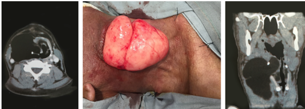
Figura 1: Paciente do sexo masculino com relato de tumoração na região cervical.

extrinsecamente a faringe, no nível do seio piriforme e obstruía a via aérea ao nível da supraglote. A lesão apresentava planos anatômicos que a separavam das estruturas adjacentes, de modo que não foi necessária a ressecção de estruturas laringeas. Permaneceu em uso de sonda nasotérica por três semanas após o procedimento, quando foi reintroduzida a dieta oral habitual, sem relato de disfagia. Um mês após o tratamento cirúrgico paciente foi decanulado, sem intercorrências. Estudo anatomopatológico evidenciou achados compatíveis com lipossarcoma bem diferenciado, ressecado com margens livres.