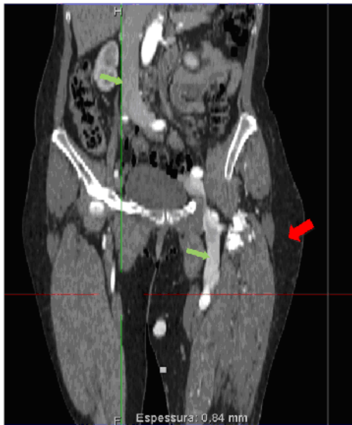
Figura 2: Reconstrução coronal da fase arterial da tomografia computadorizada, com proeminência e realce precoce das veias cava inferior e femoral esquerda (setas verdes) . Aumento das partes moles da coxa esquerda (seta vermelha).