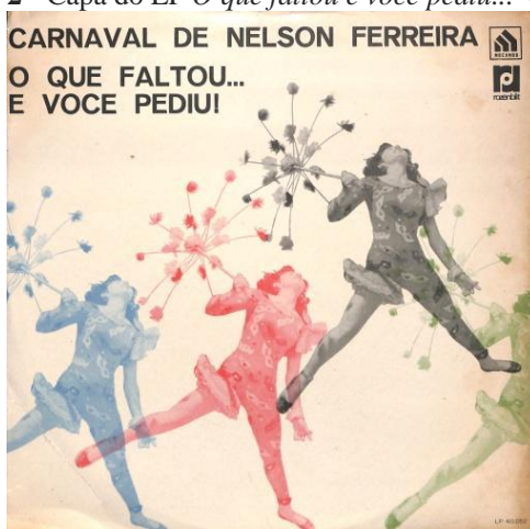
Figura 2 - Capa do LP O que faltou e você pediu... de 1968.