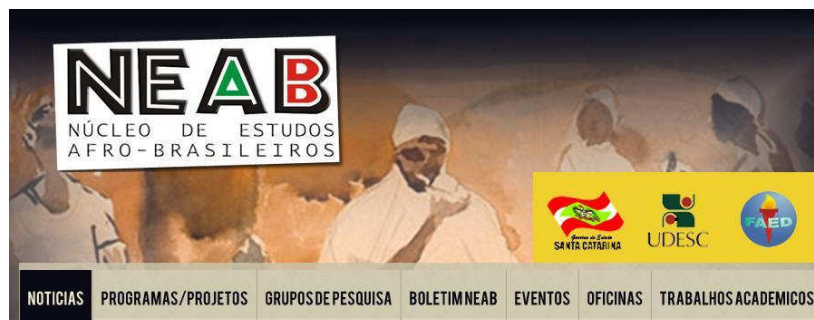
Figura 2: Home do site do NEAB ( http://www.neab.faed.udesc.br/ ).

Este ano, o Núcleo de Estudos Afro-Brasileiros da UDESC, organizou dois eventos muito importantes sobre a temática afro-brasileira. O VII Congresso Brasileiro de Pesquisadores/as Negros/as e o II Encontro Estadual do GT Estudos Africanos e da Diáspora . O primeiro, realizado entre os dias 16 e 20 de julho, teve como tema Os desafios da luta antirracista do século XXI e reuniu cerca de 1.000 participantes, entre pesquisadores/as nacionais e internacionais, acadêmicos/as e ouvintes. O segundo, realizado entre os dias 19 e 22 de agosto, teve como tema Tempo, memórias e expectativas: conexões atlânticas , tendo como participantes pesquisadores/as da temática em Santa Catarina.