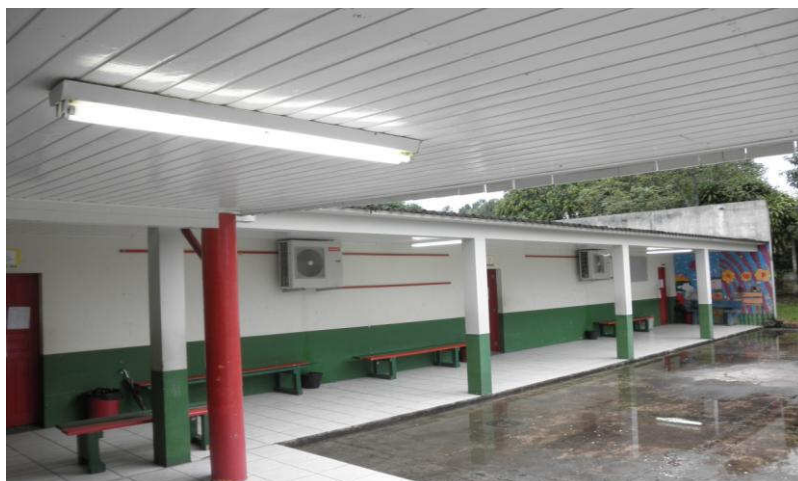
Figura 2 – Desperdício de energia com as lâmpadas acesas nos corredores da escola.

Analisando a nova situação proposta, chegamos a um consenso dos estabelecimentos mapeados para um total de 144 lâmpadas em luminárias com espelho reflexivo, de que com a redução de tempo de uso em média 12 horas/dia e 22 dias/mês, a potência total neste caso de melhoria seria de 3,92 kW, considerando 24 lâmpadas a menos do sistema atual, com menor potência e menor tempo de uso no geral. Ou seja, teríamos um melhor uso de consumo da energia elétrica, pois o consumo total (kWh/mês) do sistema proposto seria de 1.044,96 kWh/mês, resultando numa diferença significativa comparada ao sistema atual. Portanto somente nas salas de aulas já teríamos uma economia em potência (kW) dos equipamentos de 2,73 kW, e em consumo (kWh/mês) de 1.616,16 kWh/mês. Como em nosso dia-a-dia é mais difícil mensurar um valor em “kWh”, vamos considerar a tarifa de energia elétrica (R$/kWh) que é cobrada pela CELESC para estabelecimentos de educação no valor R$ 0,42175 por kWh, ou seja, a cada um (01) “kWh” de energia consumida no total dos estabelecimentos paga-se para a CELESC o valor de R$ 0,42175. Então, nas salas de aulas economizaríamos o valor de R$ 681,62 por mês. Vejamos na tabela 1 a seguir a comparação entre o sistema atual, o proposto e as economias geradas: