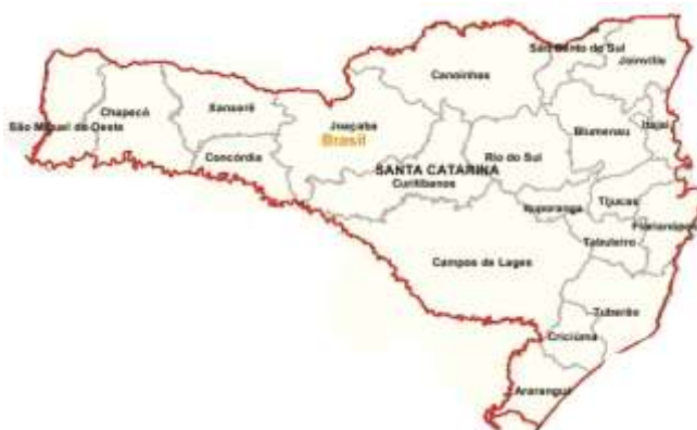
Figura 2: Microrregiões do Estado de Santa Catarina.

Já as 20 microrregiões estão divididas da seguinte forma: São Miguel do Oeste, Chapecó, Xanxerê, Concórdia, Joaçaba, Curitibanos, Canoinhas, Rio do Sul, Campos de Lages, Ituporanga, São Bento do Sul, Joinville, Blumenau, Itajaí, Tijucas, Tabuleiro, Florianópolis, Tubarão, Criciúma e Araranguá, representadas graficamente: