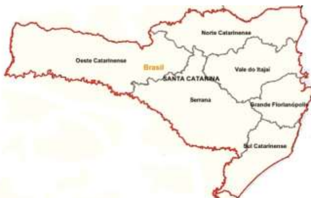
Figura 1: Mesorregiões do Estado de Santa Catarina.