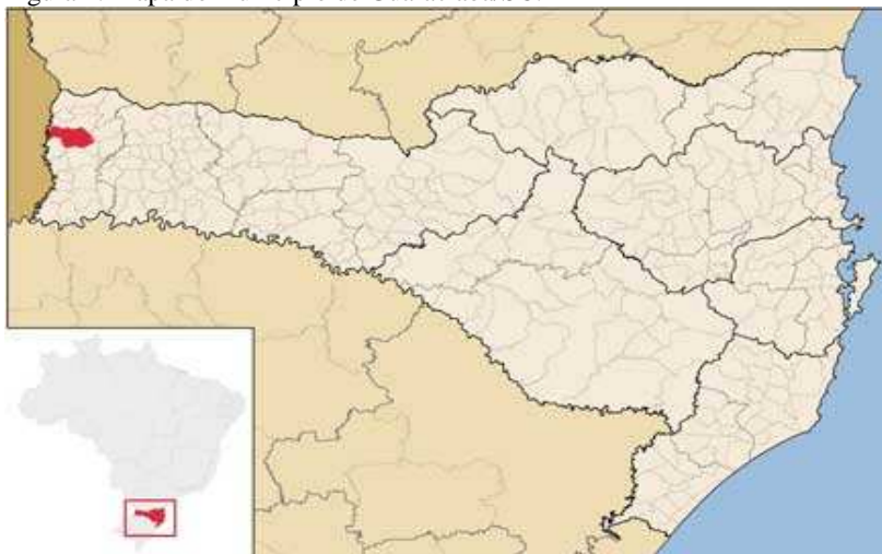
Figura 1. Mapa do município de Guaraciaba/SC.

O município conta com uma população de 10.498 habitantes, sendo destes 4.924 na área urbana e 5.574 na área rural possui um território de 330.647 km quadrados, um rebanho bovino de 31.334 cabeças, distribuídas em 1.442 estabelecimentos agropecuários cuja área média é de 25,4 ha e dos quais 1.114 trabalham na atividade leiteira. O volume de leite produzido por ano é de 27.852 mil litros e 9.605 vacas ordenhadas, segundo o IBGE (2010).