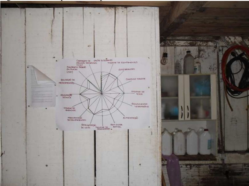
Figura 3. Gráfico tipo ameba exposto em uma sala de ordenha.

uma melhor visualização pelos agricultores, conforme sugerido por Altieri e Nicholls (2002). O gráfico foi construído pelo pesquisador, utilizando uma cartolina branca, uma tampa de panela, uma régua e pincéis de três cores diferentes. O mesmo permaneceu na sala de ordenha em local visível, de modo que os agricultores pudessem visualizar os indicadores diariamente (Figura 3).