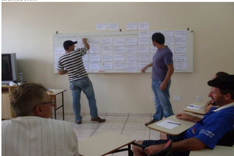
Figura 4. Quadro com as tarjetas feitas durante a dinâmica de construção dos indicadores.