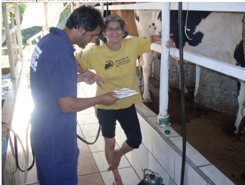
Figura 2. Realização de CMT para diagnóstico de mastite durante a caracterização do sistema de ordenha.