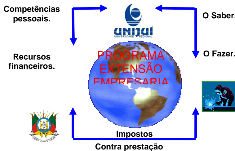
Figura 2 – Tripé da formatação do Programa – Governo x Universidade x Empresas

A formatação do Programa envolvendo a universidade como parceira e as empresas como beneficiárias do projeto, está ilustrada na Figura 2.