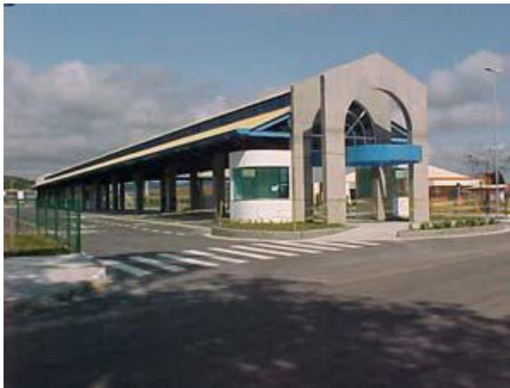
Figura 1 - Local das observações etnográficas: Terminal de Integração.

Na entrada do TI, ao lado das catracas que controlam a entrada e saída dos usuários, há duas guaritas para o pagamento da passagem ou para a recarga de créditos no cartão de transporte. Estão dispostos dentro do TI bancos de espera, lanchonetes, bebedouros, banheiros e telefones públicos para uso da população. As informações sobre horários e itinerários de todas as linhas estão afixadas em um painel, na parte central do terminal ou individualmente em cada plataforma da respectiva linha. Há sistemas de televisores instalados no terminal informando os próximos horários de partida. Relógios digitais também são componentes distribuídos em toda a extensão do TI. Para atender aos trabalhadores do transporte, existe um refeitório e banheiros exclusivos. Juntamente à guarita reservada aos fiscais, encontra-se uma central de arrecadação, onde os cobradores acertam as contas no final da jornada e recorrem em busca de troco quando necessário. Nesse mesmo local concentram-se os operadores de plantão (motoristas e cobradores). Os ônibus só podem estacionar na plataforma cinco minutos antes do horário de partida, portanto há um volume de carros alojados em terreno próximo ao terminal aguardando o momento da próxima viagem. O desenho esquemático (Figura 2) mostra a estrutura física do terminal.