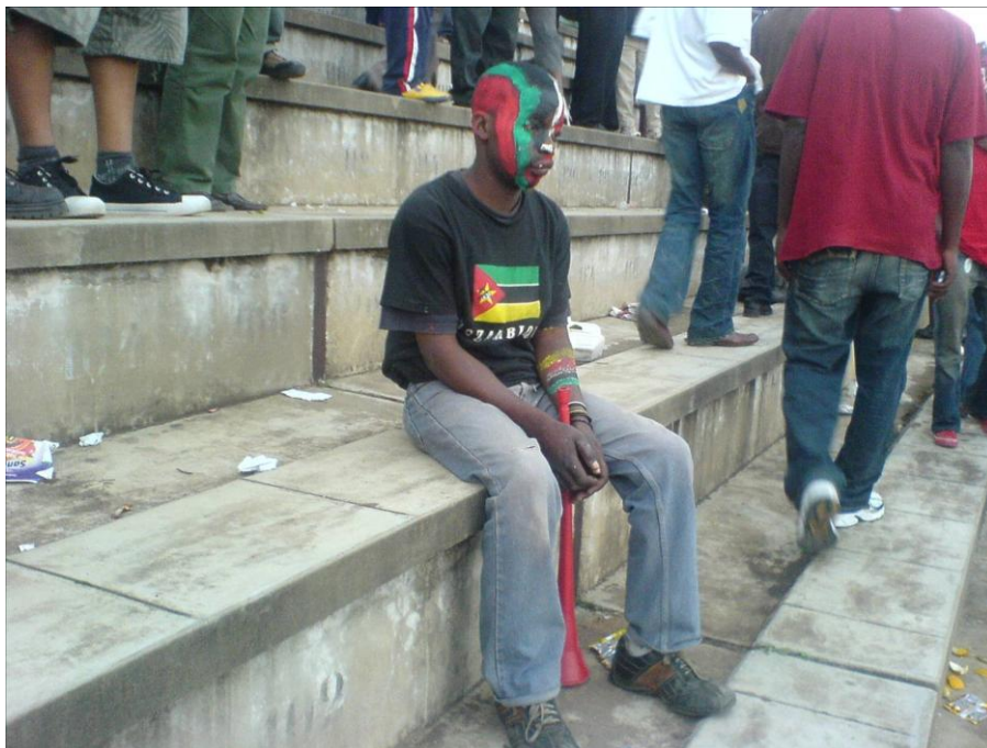
Figura 5: Jovem no Estádio da Machava.

Por outro lado, Pires (2005) conceitua cultura esportiva como uma diversidade de traços identitários comuns, especialmente quanto à lógica de sua produção e de transmissão integradas na cultura contemporânea através de um conjunto de ações, valores e compreensões que representam o modo predominante de ser/estar na sociedade globalizada no campo esportivo.