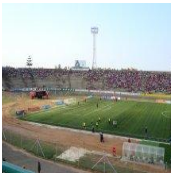
Figura 3: Estádio da Machava/Moçambique.

Dentro desse contexto, o esporte passou a ser tratado como um “direito de cada um”, esta classificação reflete a preocupação com a inclusão humano-social. Por isso, é merecedora de políticas que, embora específicas, perpassam todas as dimensões sociais. A preocupação com o humano/social deve estar, portanto, na escola, na recreação, assim como no esporte de alto rendimento.