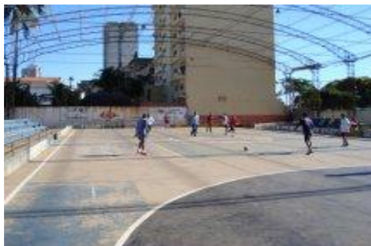
Figura 11: Perdas/degradação dos espaços esportivos na Cidade de Maputo. (2008).

Com relação aos espaços da mídia, especialmente na mídia televisiva, ainda que identifiquemos nos quadros de análise de programação, um aumento nos espaços de notícias sobre o esporte, entre os anos de 2003 e 2008, levantamos ainda algumas questões, visto que esse aspecto não é tão perceptível aos sujeitos envolvidos no estudo. Esses ainda que indiquem um progresso da mídia, em relação à abertura política trazida pelo processo de independência, são claros ao apontar que no sentido do esporte esse processo não é identificado.