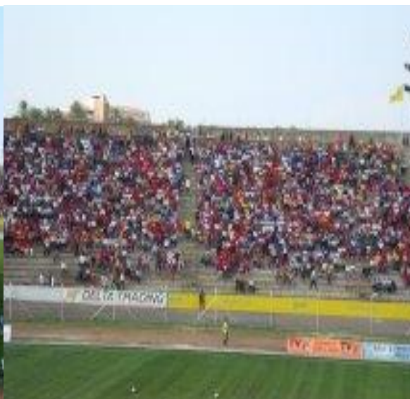
Figura 4: Estádio da Machava/Moçambique.