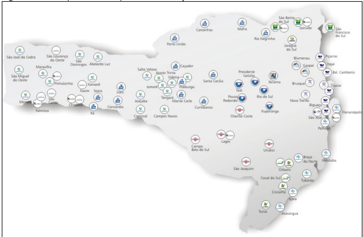
Figura 1: Distribuição das Instituições de Ensino Superior do Sistema Acafe no território catarinense.

As instituições de ensino superior pertencente ao Sistema Acafe apresentavam-se distribuídas pelo território catarinense conforme figura a seguir: