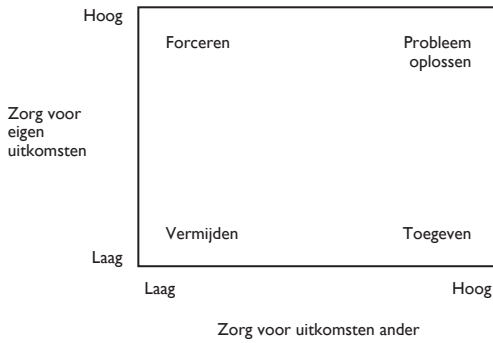
Figuur 1 Conflicthanteringsstrategieën op basis van het Tweevoudig Zorgmodel (Pruitt & Rubin, 1986)