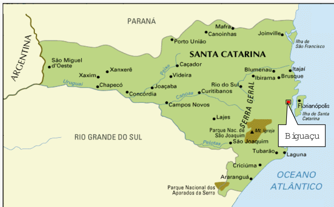
Figura 5: Localização geográfica do município de Biguaçu, SC.