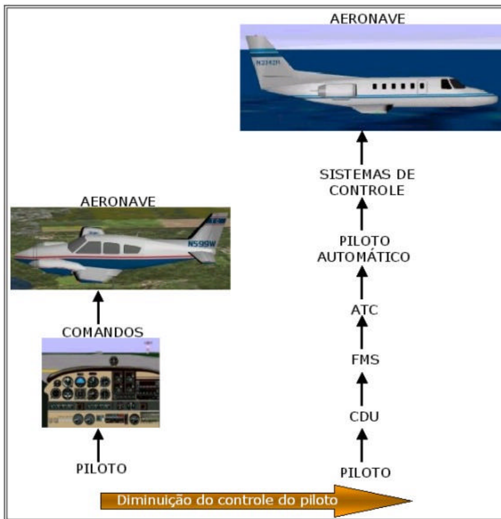
Figura 2. Evolução da automatização das aeronaves de transporte civil.

Após a segunda guerra, este princípio ampliou-se rapidamente. Os sistemas eletroeletrônicos substituíram os equipamentos primitivos e foram introduzidos sistemas como radiofarol omnidirecional (VOR), sistema de pouso por instrumentos (ILS), piloto automático (PA), sistema de advertência de proximidade do solo (GPWS), sistema anticisão de bordo (ACAS/TCAS), sistema de navegação de área (RNAV) e gestão de vôo integrados ao PA, além de sistemas de controle que impedem que a aeronave ultrapasse seus limites de segurança operacional. Todos estes equipamentos e sistemas de vôo, elevaram a complexidade da automatização das aeronaves de transporte civil. “Os pilotos que em um momento tiveram sob seu poder todos os aspectos de controle e gestão da aeronave, agora são responsáveis pela gestão de complexas interfaces com suporte físico e lógico, mediante a qual devem operar os aviões” (ICAO, 1992, p.4). A figura a seguir representa a mudança que a automatização provocou no posto de pilotagem e o afastamento do controle do piloto sobre a mesma.