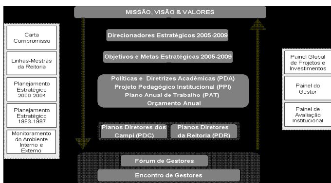
FIGURA 02: Estrutura de Trabalho da Metodologia de Planejamento Estratégico.

Entre outubro de 2003 e fevereiro de 2004, foi processada a atualização da análise do ambiente externo e debatido o tema dentro da área de planejamento da Universidade. Em conjunto com este trabalho, outro relatório reservado à reitoria com os principais fatos e tendências identificadas no seguimento de Educação Superior, produzido com periodicidade quinzenal, passou a ser compartilhado com os demais gestores universitários. Estas medidas passaram a alimentar continuamente todos os gestores universitários com dados estratégicos, criando um clima de confiança e de melhor entendimento e consciência sobre os impactos de eventos do mercado de negócios e cenários que a Universidade tem que enfrentar a cada dia.