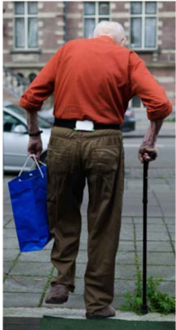
Afbeelding 1. Deelnemer met bewegingsmonitor, welke gebruikelijk onder de bovenkleding werd gedragen.

Tijdens het huisbezoek werd de bewegingsmonitor uitgereikt en werden beschrijvende gegevens als geslacht, leeftijd, gewicht, lengte, valgeschiedenis, woonsituatie en het gebruik van een loophulpmiddel geregistreerd. Daarnaast werden gevalideerde vragenlijsten en testen voor factoren die het risico op vallen verhogen, afgenomen. Deze testen bestonden uit Nederlandse bewerkingen van het LASA valrisicoprofiel (Tromp e.a., 2001), cognitieve functie (MMSE score), executieve functies (trail making test A