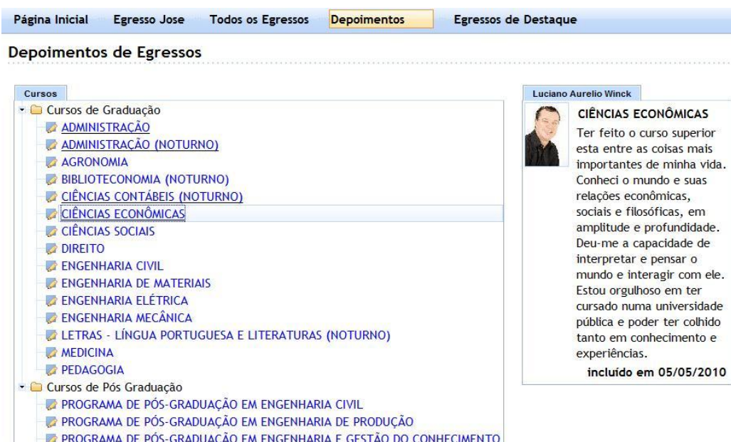
Figura 5: Publicação dos depoimentos dos egressos.

Os depoimentos são publicados como mostrado na Figura 5 . Assim, a administração universitária e a sociedade podem conhecer a visão de seus egressos sobre o curso e a gestão universitária, podendo servir de subsídios para escolha de cursos pelos candidatos ao vestibular.