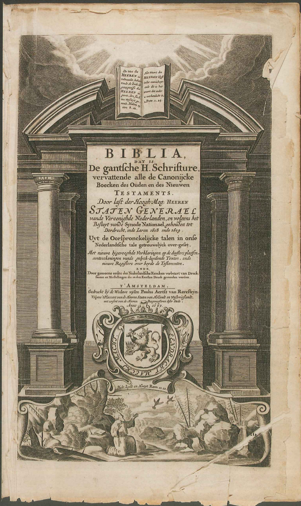
De gantsche H. Schrifture, vervattende alle de canonycke boecken des Oude(n) en des Nieuwen Testaments [...]. Uyt de oorspronckelijcke talen in onse Nederlantsche tale [...] overgeset, Amsterdam, 1660, SPKK od53

In elke religie met een heilig boek wordt het aan kinderen verteld: voorzichtig, dit is een Heilig Schrift en geen gewoon boek, ga er behoedzaam mee om. Toch zijn er heilige boeken die sporen van intensief gebruik verraden. Een voorbeeld uit de collectie van Museum Catharijneconvent is de zogenaamde Tornadobijbel, nu te zien in de tentoonstelling Heilig Schrift – Tanach, Bijbel, Koran.