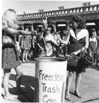
Afb. 1: De oorsprong van de mythe van de brandende bh. Deze foto lijkt het bewijs te zijn dat de Freedom Trash Can wel degelijk in de brand is gestoken. Van een rituele 'bh-verbranding' is echter geen sprake geweest.