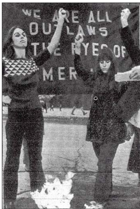
Afb. 3: Vrouwen van de aangeklaagde 'Chicago Seven' verbrandden toga's in maart 1970. Bron: 'Verdict on the Chicago Seven: From Court to Country', Time. The Weekly Newsmagazine , 95.9 (2 maart 1970) 14.

Ook voor Dolle Mina gold dat dit bijna allemaal mensen waren die al eerdere ervaring hadden opgedaan in de linkse studentenbeweging. In dat kader is het interessant om naar inspiratiebronnen buiten de vrouwenbeweging te kijken. Een foto uit Time in maart 1970 toont opvallende overeenkomsten. Daarop staan twee vrouwen afgebeeld die een toga verbrandden (afbeelding 3). Dit deden zij als teken van wantrouwen jegens de rechters in het proces tegen hun echtgenoten, de Chicago Seven. 70 De vlammen, de vuisten, de trotse houding: de overeenkomst met foto's van de korsetverbranding is frappant.