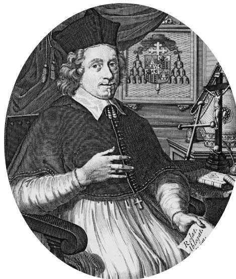
Jacobus de la Torre. Gravure, 17de eeuw. [Leuven, KU Leuven, Centrale bibliotheek: BRES PA02239]

Uit het voorgaande wordt duidelijk dat Wachtelaer een verdediger was van een theologie die openstaat voor de