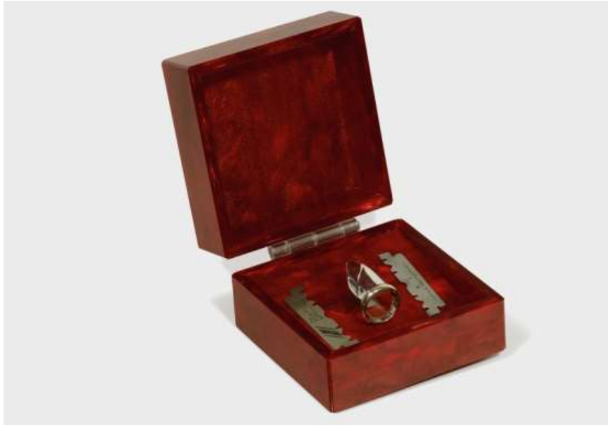
Figura 9. Unha Navalha, 2016, da série Próteses Bélicas. Prata, aço, madeira, espuma, veludo e cetim, 5,4x6,9 x7,3 cm