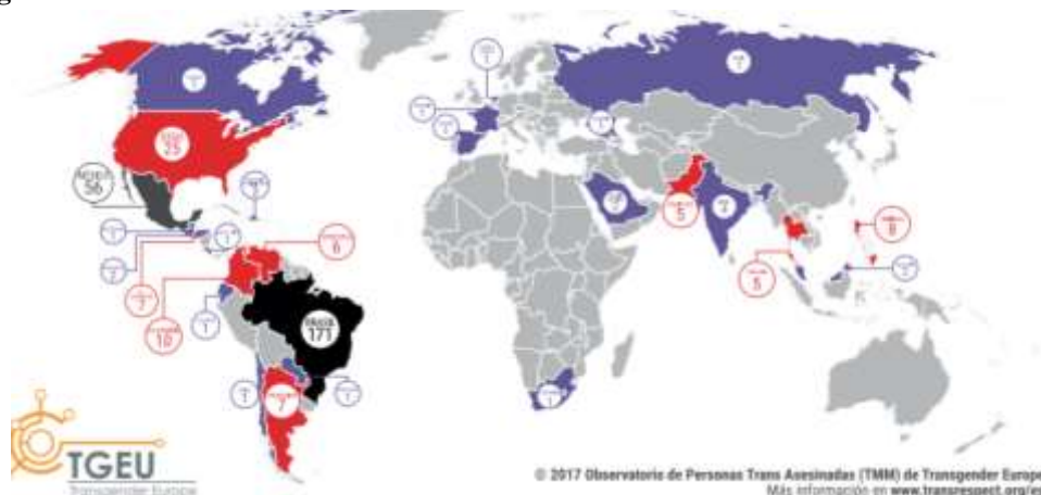
Figura 1. Pessoas Trans Assassinadas entre Outubro de 2016 e Setembro de 2017 no Brasil