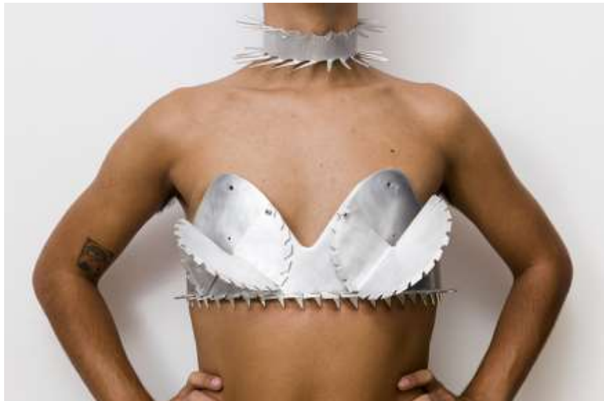
Figura 10. Próteses Bélicas