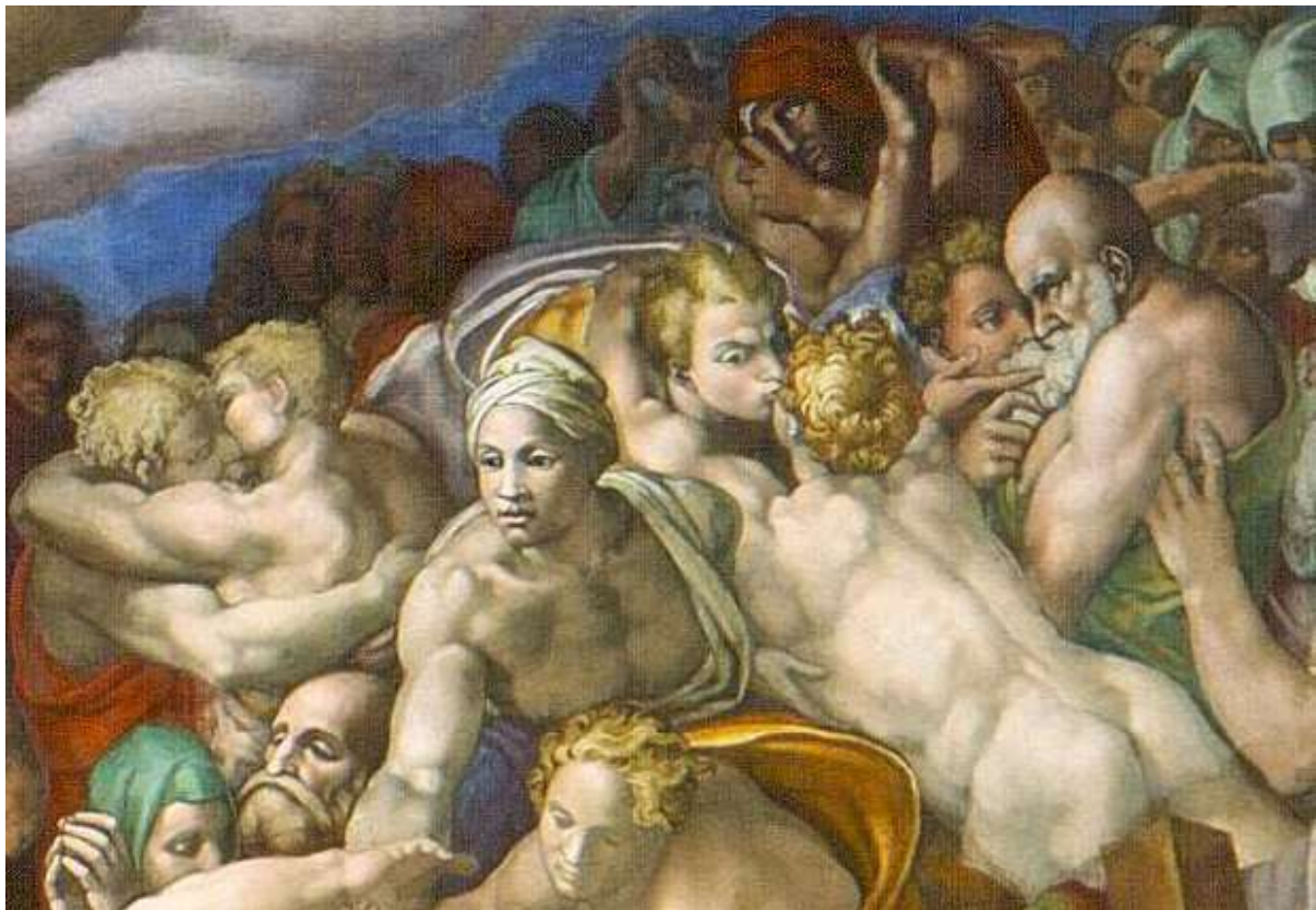
Figura 2. Capela Sistina, pintura afresco (1508-1512) de Michelangelo, Palácio Apostólico, Vaticano

Fonte: Imagem registada em Huffpost , disponível em: https://www.huffpostbrasil.com/2017/09/13/9-obras-de-arte-consagradas-da-historia-que-retratam-genero-e-sexualidade-a-23208027/ .