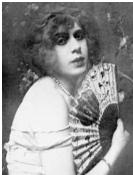
Figura 4. Lili Elbe, 1926