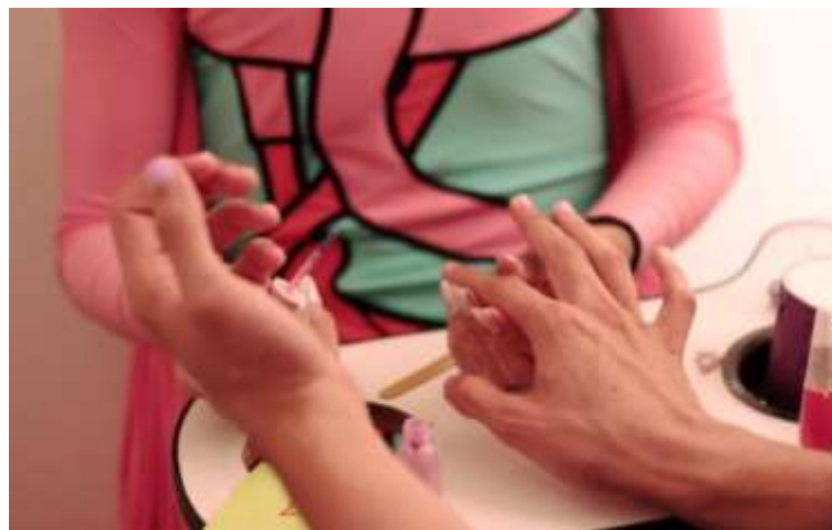
Figura 7. Manicure Política, 2016, dispositivo itinerante