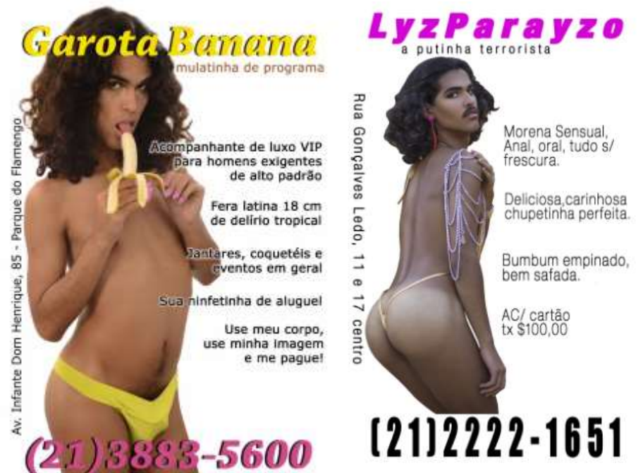
Figura 6. Putinha Terrorista, 2017, papel couchê, 10x14cm