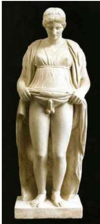
Figura 3. Hermafrodito. Império romano. 27A.C. - 476 D.C.