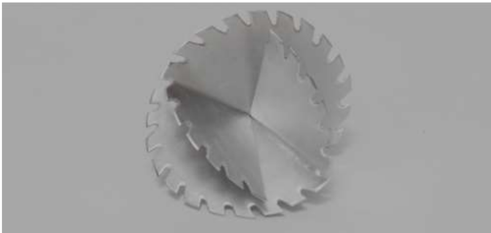
Figura 8. Bixinhas, 2018, alumínio, 15x15cm