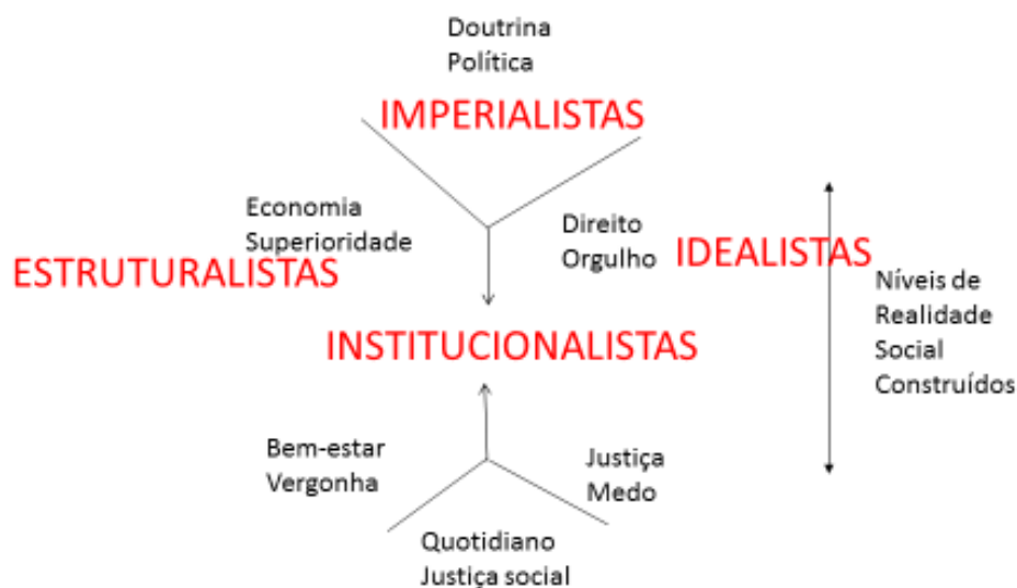
Figura 1. Paradigmas centrípetos

Que instrumentos têm as teorias sociais para identificar e lidar com o fim de ciclo? Como observar e comentar as transformações em curso? Moravesik (2000) recenseia várias maneiras de valorizar os direitos humanos, a saber: a idealista (as normas têm efeitos práticos), a imperialista (instrumento de legitimação de superioridade dos neo-colonialistas), a institucionalista (reforma das organizações para transformar as sociedades). Podemos acrescentar a maneira estruturalista, como a que faz decorrer das dinâmicas das lutas de classes as organizações e ideologias observáveis (ver figura 1).