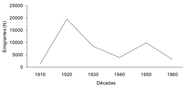
Figura 3 Emigração portuguesa para a Argentina, 1910-1960