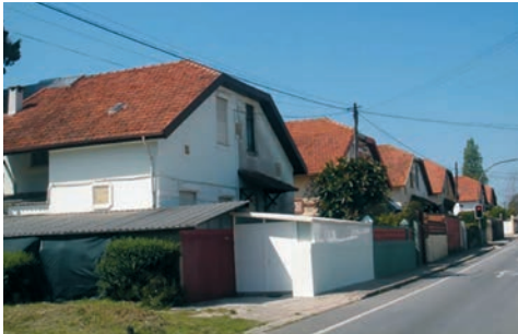
Figura 5 – Casas Colónia Viterbo Campos