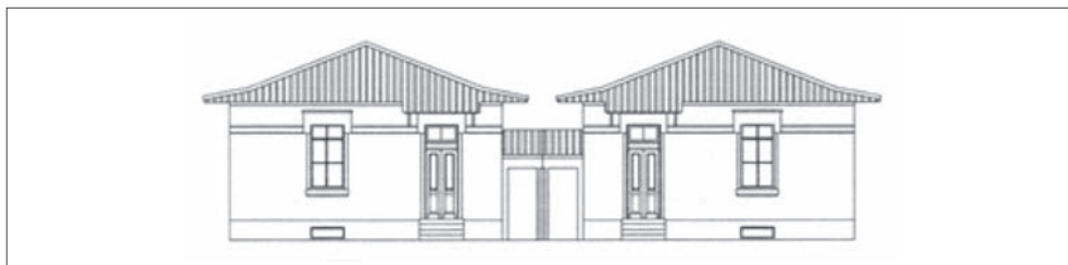
Figura 2 – Habitação tipo 1 Alçado Principal