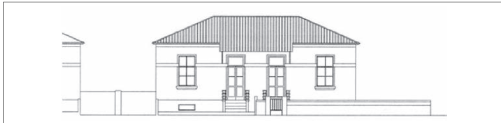
Figura 1 – Alçado Principal