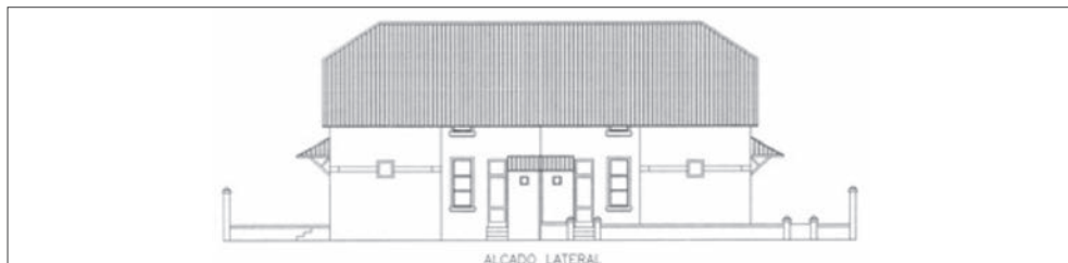
Figura 4 – Alçado Lateral