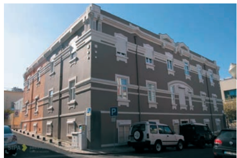
Figura 9 – Edifícios quadrangulares de 3 pisos