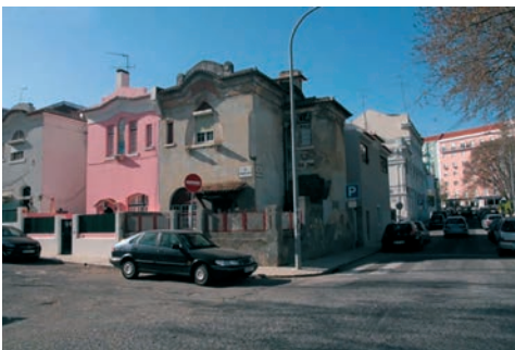
Figura 8 – Bandas geminadas de habitações unifamiliares de 2 pisos