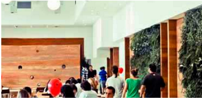
Google Brasil, Americana - SP 2015