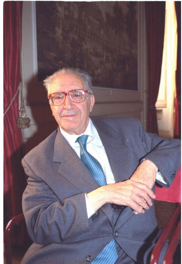
Fig. 5 - Giovanni Pugliese Carratelli

La produzione scientifica di Pugliese Carratelli in campo anatolistico non è molto vasta; quello che egli intendeva fare non era dedicarsi egli stesso a questo settore di ricerca, quanto piuttosto aprire una nuova via da affidare poi a un qualche giovane capace. Tuttavia, alcuni degli studi ittologici di Pugliese Carratelli sono ancora di grande interesse, soprattutto per la sua capacità di correlare tra di loro aspetti e tradizioni di mondi lontani. Questo è il caso, ad esempio, dell'ultimo saggio ittologico scritto da Pugliese Carratelli (1994) e dedicato all'analisi della parte finale dell'editto emanato dal re ittita Hattusili I e noto come il "Testamento": il contenuto e lo stile di questo paragrafo sono comparati da Pugliese Carratelli con un passo del decimo inno dei Rgveda .