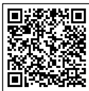
Figura 2. Código QR para acceder al Programa del Segundo Foro de Competencia Lingüística.

Los ponentes provinieron de nuevos espacios académicos, ocho de la UAEMex (siete Facultades y el Centro Universitario Zumpango - CUZ), así como de la Centenaria y Benemérita Escuela Normal para Profesores (CBENP). Las facultades participantes fueron: Lenguas, Geografía, Odontología, Humanidades, Turismo y Gastronomía, Medicina y Ciencias de la Conducta (Figura 3).