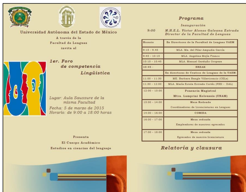
Figura 1. Cartel del 1er Foro de competencia Lingüística

El Segundo Foro de Competencia Lingüística se suspendió en el 2016 ya que el CA Estudios en Ciencias del Lenguaje, en conjunto con el CA Estudios en Lingüística y Docencia, organizó en dicho año el Primer Foro Nacional de Investigación y Estudios Avanzados de la Facultad de Lenguas. Para 2017, el CA Estudios en Ciencias del Lenguaje realizó una reingeniería en su estructura por lo que para ese año tampoco se organizó el Foro del CA.