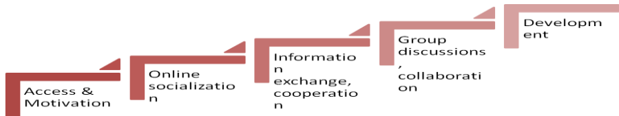
Fig. 1 – Stadi della progettazione di OOC

Development: il discente è artefice del proprio apprendimento.