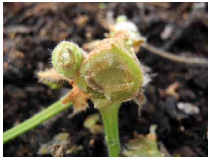
Figura 3 - Imbrunimenti vascolari causati da Verticillium nonalfalfae su Pelargonium grandiflorum "Fabiola": sezione trasversale. Figure 3 - Vascular browning caused by Verticillium nonalfalfae on Pelargonium grandiflorum "Fabiola": transverse section.

I conidi erano numerosissimi, ialini, da ellittici con apici arrotondati a ovali ed avevano dimensioni di 3,1-6,7 \times 1,7-3,5 (media: 5,1 \times 2,5 ) \mu\text{m} (Fig. 4f). Non venivano osservati microsclerozi.