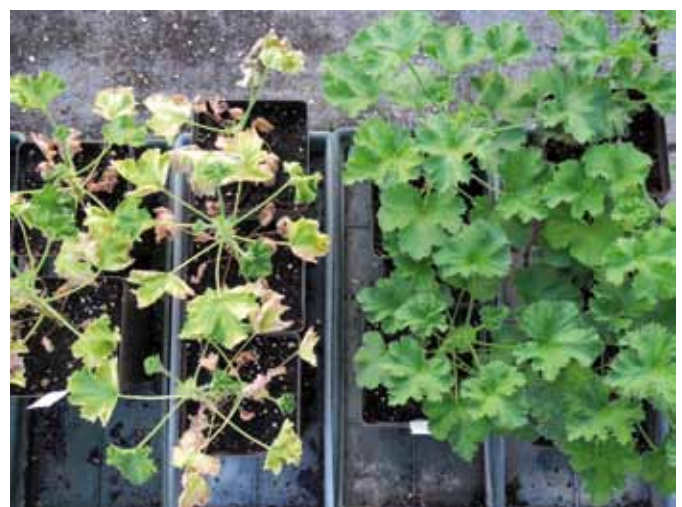
Figura 5 - Test di patogenicità su piante di Pelargonium grandiflorum "Fabiola" allevate in vaso e artificialmente inoculate con l'isolato DB15APR01-M1 di Verticillium nonalfalfae : a destra i testimoni non inoculati.

Su ospiti appartenenti al genere Pelargonium vengono riportati sia V. dahliae , sia V. albo-atrum . Quest'ultimo è stato segnalato negli Stati Uniti, su P. × hortorum e P. domesticum (Baker et al. , 1940), in Inghilterra su P. domesticum (Fletcher e Griffin, 1972), in Polonia su Pelargonium sp. (Orlikowski, 1995). Nel nostro Paese, la presenza di V. dahliae su P. grandiflorum è nota da tempo (Garibaldi e Gullino, 1973). V. nonalfalfae è una specie di recente introduzione che annovera come ospiti Solanum tuberosum , Spinacia oleracea , Humulus lupulus e