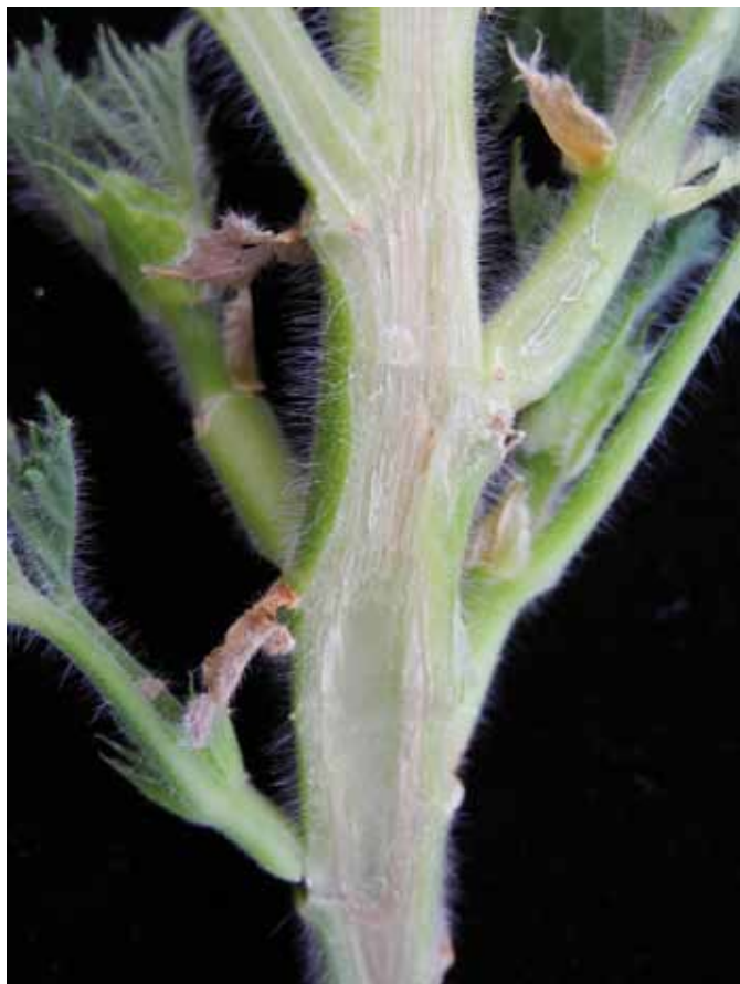
Figura 2 - Imbrunimenti vascolari causati da Verticillium nonalfalfae su Pelargonium grandiflorum "Fabiola": sezione longitudinale. Figure 2 - Vascular browning caused by Verticillium nonalfalfae on Pelargonium grandiflorum "Fabiola": longitudinal section.