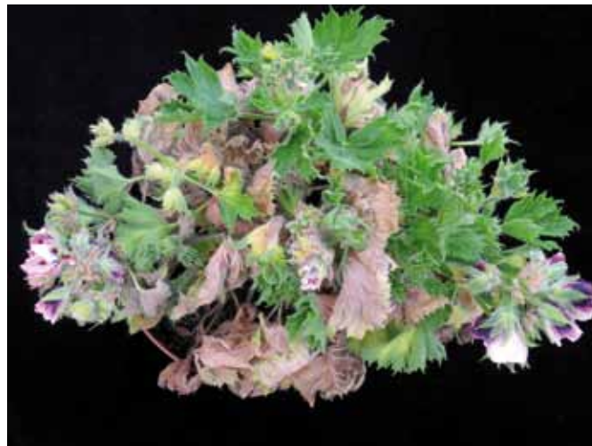
Figura 1 - Sintomi causati da Verticillium nonalfalfae su Pelargonium grandiflorum "Fabiola" allevato in vaso.

Il genere Pelargonium , famiglia Geraniaceae, comprende numerose specie e varietà, molte delle quali coltivate e commercializzate come vaso fiorito: una di queste è Pelargonium grandiflorum Willd. In questa nota vengono riportate le alterazioni osservate sulla cv Fabiola di questa specie e mai descritte prima d'ora su questa specie.