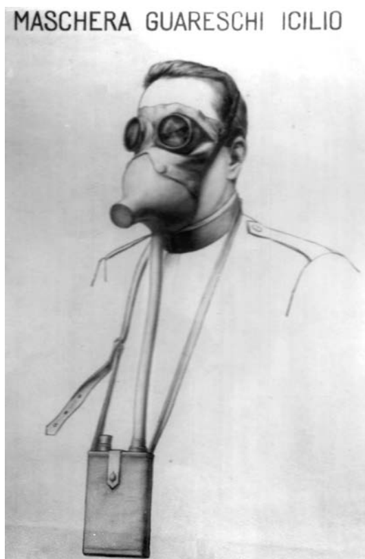
Fig. 2. Uno dei vari prototipi della maschera Guareschi.

– facciale: costruito in gomma elastica piuttosto consistente e sagomato in modo da coprire bocca e naso, era assicurato al viso per mezzo di un tirante elastico e portava montata all'altezza della bocca (a maschera indossata) una valvola, inserita nel tubo flessibile e sostanzialmente costituita da una semplice membrana. Detta membrana era costretta in modo che: durante l'inspirazione lasciava entrare l'aria nel facciale; all'iniziare della fase espirativa, in forza della pressione che la stessa creava all'interno del facciale, impediva tale ingresso. Invece, un'altra valvola, a molla, montata all'altezza del naso (a maschera indossata), era tarata in modo da aprirsi all'aria espirata, lasciandola uscire dal facciale, e richiudersi quando la pressione esercitata dalla stessa veniva a mancare, ossia quando cominciava la fase inspirativa.