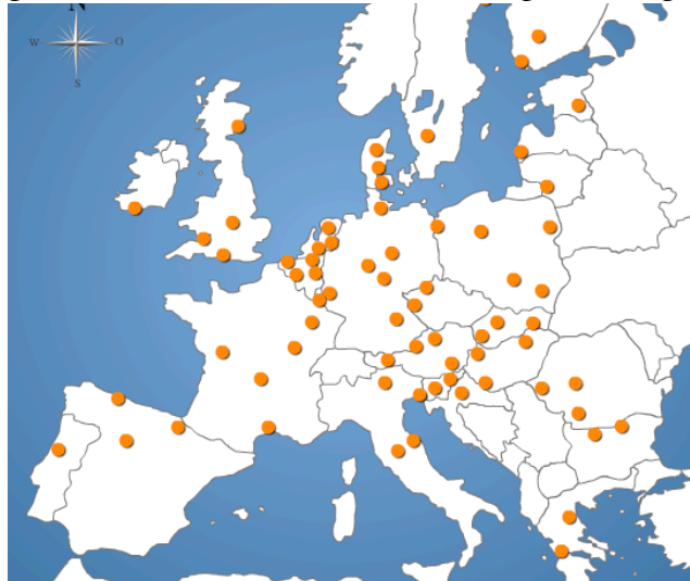
Fig. 1 – La rete delle settanta città europee intelligenti

Ancona e Perugia– occupano rispettivamente le posizioni numero 45, 49, 51, 52 (Fig. 2).