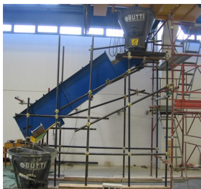
Fig. 1. Apparato sperimentale

formazione di bolle di aria, che potrebbero falsare le misure, sovrastimandone i valori (Bagnold, 1939).