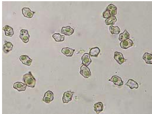
E. cetratum . Spore. Foto di Eliseo Battistin E. cetratum . Basidi. Foto di Eliseo Battistin