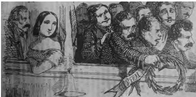
6. I palchi del teatro Apollo di Genova quando recita Gustavo Modena ("La Maga", 31 maggio 1856)