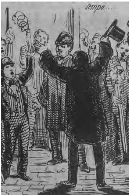
9. Particolare delle acclamazioni a Gustavo Modena. L'attore è al centro, con il cappello in testa. L'uomo sulla destra, con la torcia in mano e il berretto frigio, è Giuseppe Mazzini ("La Maga", 13 maggio 1856)