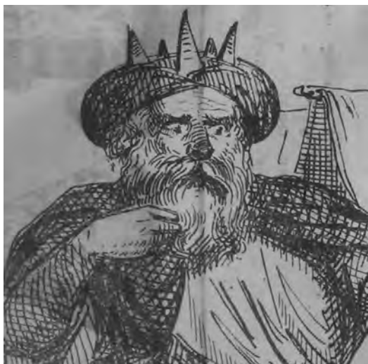
4. Particolare della caricatura di Modena che recita Saul (“La Maga”, 24 maggio 1856)