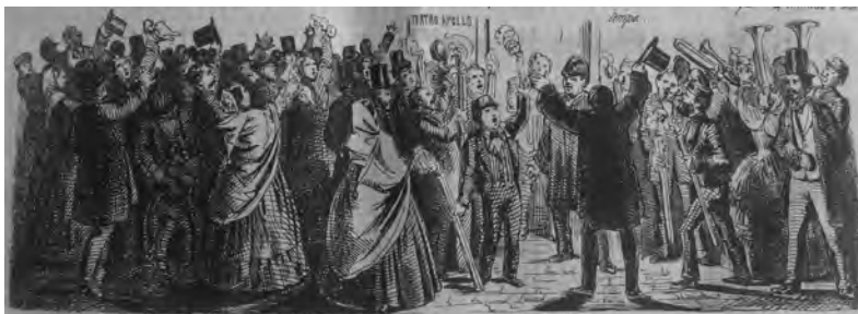
8. Il pubblico genovese acclama Modena dopo una rappresentazione al teatro Apollo di Genova ("La Maga", 13 maggio 1856)