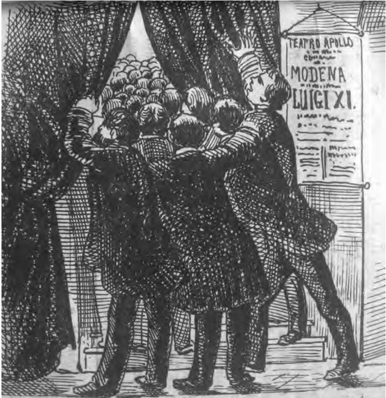
5. Il pubblico del teatro Apollo di Genova quando recita Gustavo Modena ("La Maga", 13 maggio 1856)