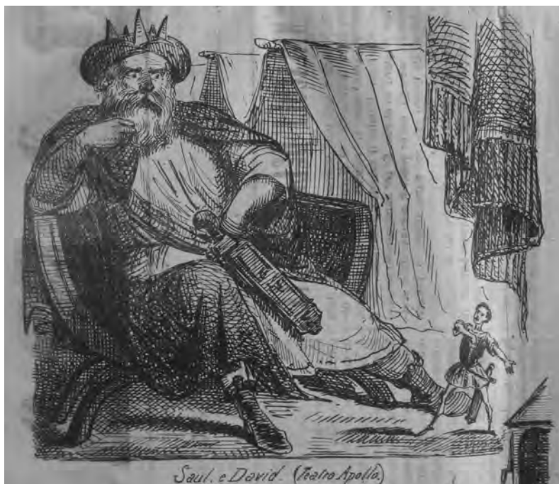
3. Caricatura di Gustavo Modena che recita Saul di Vittorio Alfieri (“La Maga”, 24 maggio 1856)