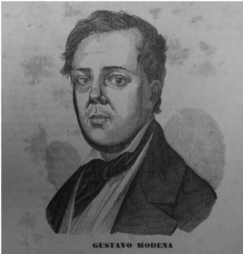
1. Ritratto di Gustavo Modena ("Il Fuggilozio", 2 gennaio 1858)