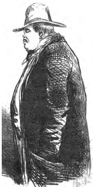
10. Ritratto di Gustavo Modena fuori dalle scene ("Il Trovatore", 10 luglio 1858)