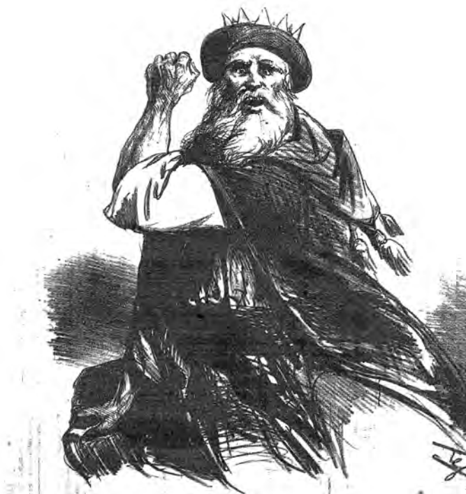
7. Disegno di Gustavo Modena che recita Saul ("Il Trovatore", 10 luglio 1858)