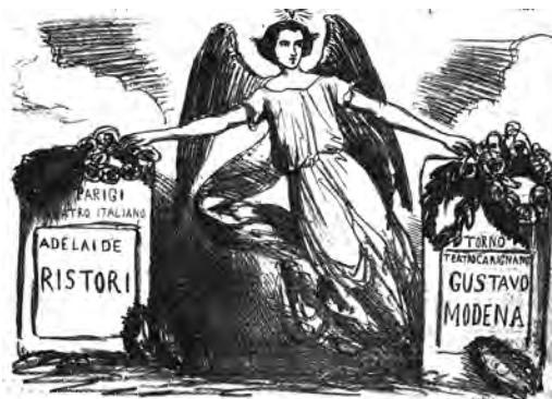
11. “Due nomi che fan risplendere di nuova luce il genio italiano sì in patria che all'estero” (“Il Trovatore”, 16 aprile 1856)