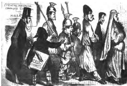
12. Caricatura delle comparse della Compagnia Reale Sarda in tournée con Adelaide Ristori nel 1855 (“Il Trovatore”, 15 dicembre 1855)