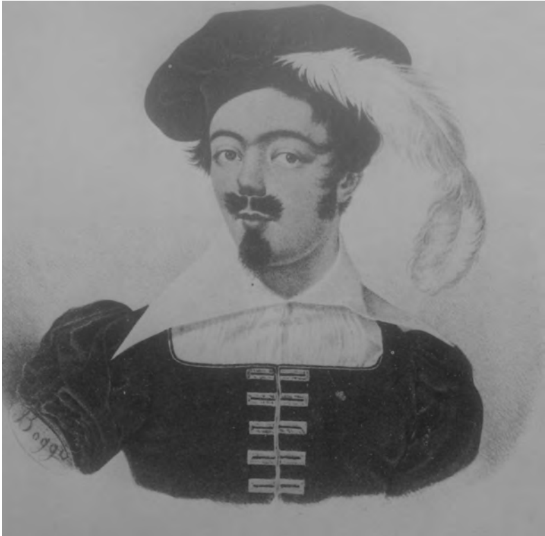
2. Gustavo Modena recita Paolo nella Francesca da Rimini di Silvio Pellico (“Il Dramma”, 15 aprile 1948)