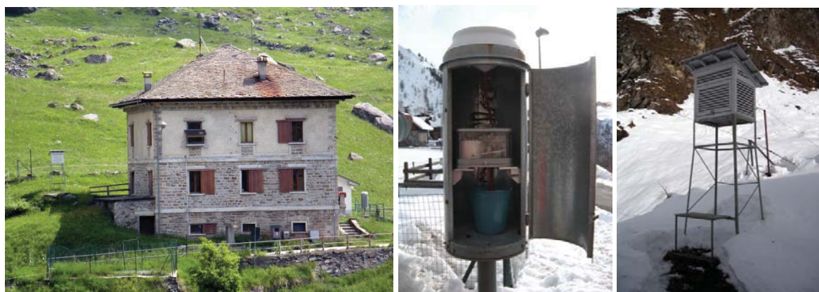
Figure 2 : A gauche : station de Alpe Cavalli située près de la maison des opérateurs du barrage ; en centre : le pluviographe à bascule, situé sur le côté Sud ; à droite : le poste climatologique, situé sur le côté Nord.

L'étude de la variabilité climatique dans la haute vallée Antrona a été réalisée à partir des données de la station de l'Alpe Cavalli (1500 m), située dans le village de l'Alpe Cheggio (46°05' / 08°07'). La station a été installée en 1928 suite à la construction d'un barrage par la société Edison. Il s'agit d'une station nivométéorologique manuelle, avec un thermomètre à maximum et à minimum, un pluviographe, une barre graduée fixe pour mesurer la hauteur du manteau neigeux et une tablette de bois pour la quantité de neige fraîche.