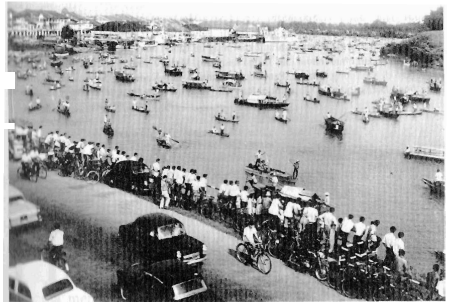
Upacara menuba ikan di Sungai Sarawak salah satu acara tahunan 1931-1941.