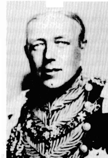
Raja Sir Charles Vyner Brooke G.C.M.G., Raja Negeri Sarawak yang Ketiga (1917-1946).