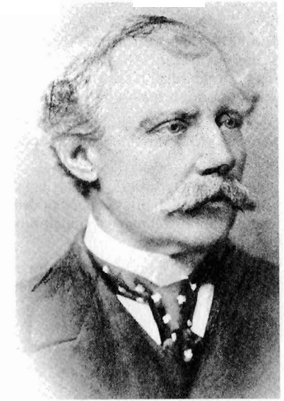
Charles Brooke, Raja Kedua Sarawak.