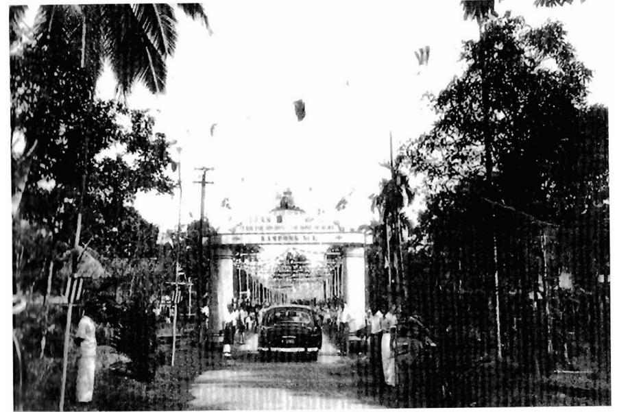
Kampung Melayu yang mewarnai Jalan Datu sejak dibina oleh Kerajaan pada tahun 1930. Pintu gerbang yang tersergam itu, untuk menyambut pelawat daripada keluarga Diraja British.

Pasar lama di Main Bazaar dan Gambier Street merupakan kawasan yang sibuk dengan hiruk-pikuk aktiviti perniagaan. Pusat bandar merupakan satu-satunya kawasan yang padat di Kuching ketika itu. Kawasan itu mempunyai rumah kedai orang Cina yang dibina rapat-rapat antara satu dengan lain; menjadikannya kawasan paling sesak. Penduduk di Kuching, termasuk dari kampung Melayu di seberang sungai biasanya bertumpu di kedai-kedai berkenaan untuk membeli-belah pada sebelah pagi. Bagi bandar Kuching, kawasan yang penuh sesak sebahagian besarnya terletak di Jalan Masjid dan Jalan MacDougall—sebuah kawasan kecil di antara dua jalan tersebut dengan sungai, dan pejabat-pejabat kerajaan di tengah-tengah kawasan ini.