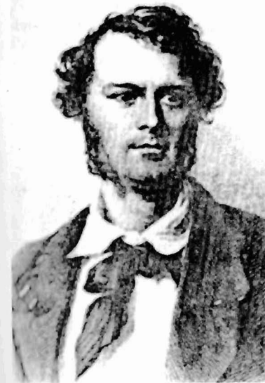
James Brooke, Raja Pertama Sarawak.

Sambutan orang ramai begitu luar biasa. Keadaan dan suasana di tebing Sungai Sarawak begitu meriah, dengan orang ramai begitu teruja apabila melihat segala macam rekaan. Mereka kagum dengan bahtera rekaan penduduk Kampung Nombor Empat, apatah lagi apabila melihat gaya kelasi dan ratu di atas singgahsana kapal.