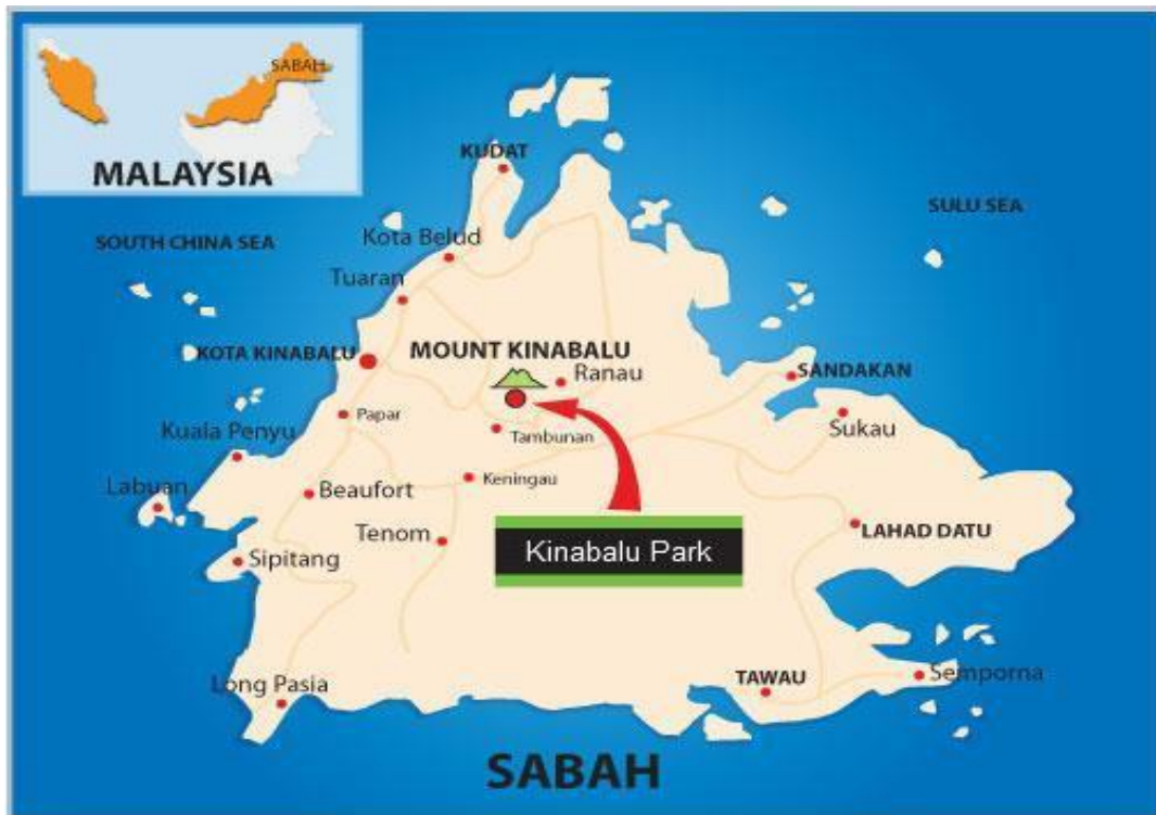
Gambar 1.7.1 : Peta Taman Kinabalu.