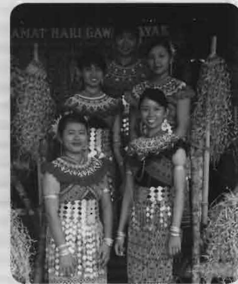
Gambar 1.2: Anak gadis Iban di Bahagian Sri Aman, Sarawak, sedang memakai pakaian tradisional Iban yang lengkap semasa menyambut perayaan Hari Gawai Dayak pada 1 Jun 2008.

Setelah mereka hidup sekian lama di petempatan awal, khususnya di Bahagian Sri Aman, mereka mendapati bahawa kawasan tanah pertanian untuk menanam padi bukit dan padi paya tidak lagi subur sepertimana suatu ketika dahulu. Oleh itu, mereka mula meninggalkan tempat-tempat tersebut untuk mencari satu petempatan yang baru, terutamanya di Bahagian Miri, Bintulu dan Limbang. Pada pendapat mereka, di tempat baru tersebut mereka senang mendapatkan binatang buruan dan juga tanah pertanian yang lebih subur bagi mendapatkan hasil tuaian padi yang lumayan.