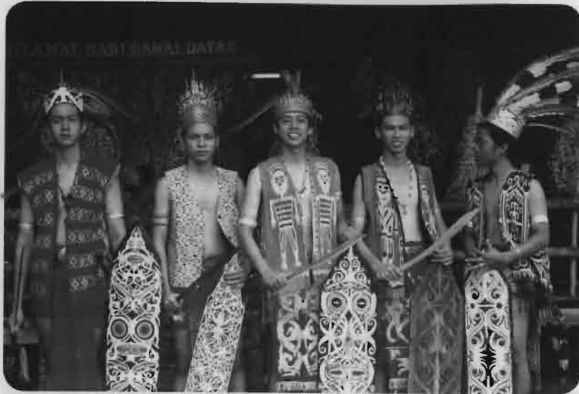
Gambar 1.1: Anak muda lelaki Iban di Bahagian Sri Aman, Sarawak sedang memakai pakaian tradisional Iban yang lengkap semasa menyambut perayaan Hari Gawai Dayak pada 1 Jun 2008.

Setelah mereka hidup sekian lama di petempatan awal, khususnya di Bahagian Sri Aman, mereka mendapati bahawa kawasan tanah pertanian untuk menanam padi bukit dan padi paya tidak lagi subur sepertimana suatu ketika dahulu. Oleh itu, mereka mula meninggalkan tempat-tempat tersebut untuk mencari satu petempatan yang baru, terutamanya di Bahagian Miri, Bintulu dan Limbang. Pada pendapat mereka, di tempat baru tersebut mereka senang mendapatkan binatang buruan dan juga tanah pertanian yang lebih subur bagi mendapatkan hasil tuaian padi yang lumayan.