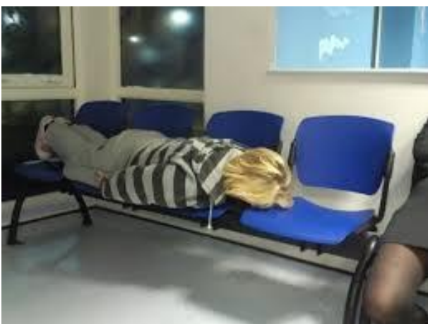
Fig 3. Esempio di “Lying down game” URL: https://www.nursingtimes.net/news/hospital/hospital-staff-reinstated-after-lying-down-game-suspensions/5007351.article (acceduto il 17/10/2017)

Un esempio di comportamento non coerente con i principi etico-professionali che si è verificato negli Stati Uniti è il cosiddetto “Lying down game” che consiste nel pubblicare in rete immagini personali in posizione prona in luoghi pubblici. Infermieri, medici e psicologi che hanno partecipato a questo “gioco” hanno utilizzato per lo più lettini ospedalieri situati in sale operatorie e ambulanze oppure poltrone in sale d'attesa (vedi figura 3).