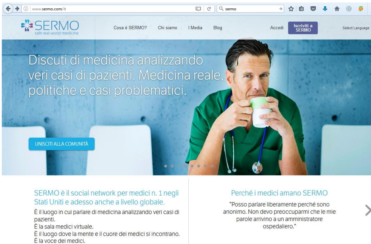
Fig. 2. Homepage del Social Network Site Sermo, in lingua italiana