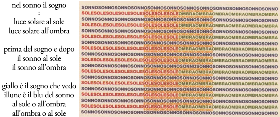
Figura 3 – Arrigo Lora Totino, Nel sonno il sogno , cromofonema, 1977

Come si può osservare, la composizione concreta traduce in rapporti spaziali quanto espresso dal testo lineare, ovvero – in ottemperanza al titolo – la parola “sogno” si trova nel centro della composizione, all’interno cioè dello spazio delimitato dalle stringhe formate dalla parola “sonno” (“nel sonno il sogno”). La linea costituita dalle parole “sole/ombra”, esattamente bipartita nelle due unità lessicali, riproduce i versetti incipitari “luce solare al sole / luce solare all’ombra”. Così, nella figura, la stringa con la parola “sonno” è preceduta e seguita dalle linee centrali formate dal sostantivo “sogno” (“prima del sogno e dopo”), ed è in rapporto con la stringa suddivisa equamente tra i vocaboli “sole” e “ombra”: “il sonno al sole / il sonno all’ombra”. Sono inoltre rispettati i colori attribuiti ai nomi: giallo per il “sogno” e blu per il “sonno”; mentre per le parole “sole” e “ombra” sono impiegati, rispettivamente, il rosso e il verde. Da notare come siano utilizzati i tre colori primari (giallo, blu, rosso), cui si aggiunge il verde, colore secondario che deriva dall’unione del giallo e del blu, attribuito all’ombra.