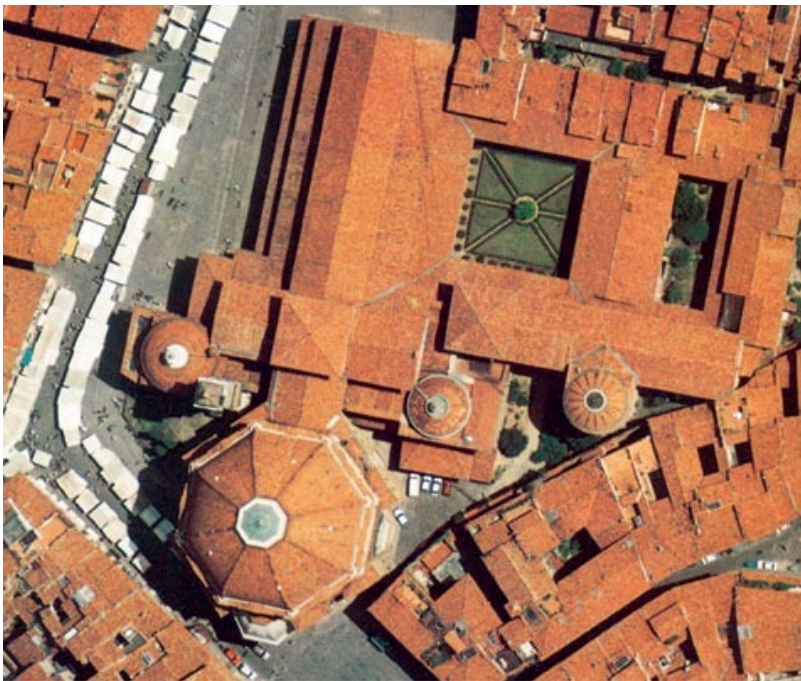
Figura 3. San Lorenzo, Firenze (foto aerea).

A destra: Figura 2. Il chiostro di Ognissanti, Firenze.