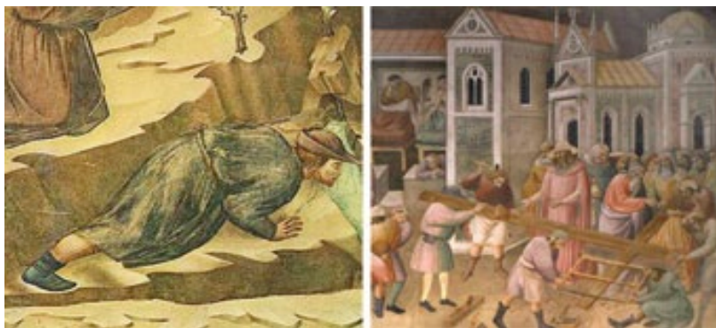
Giotto, Il miracolo della fonte (1290-1295 circa), Assisi, San Francesco, Basilica superiore. Agnolo Gaddi, Le storie della vera croce (metà XIV sec.), Firenze, Chiesa di Santa Croce.

È un periodo nel quale l'interesse verso la cultura e verso le arti si rafforza e si diffonde: Dante, Petrarca e Boccaccio elogiano Giotto che disegnava "si simile" alla natura, e Giotto stesso, come dice Vasari (1991, 118), ritrae "nella cappella del Palagio del Podestà di Fiorenza, l'effigie di Dante Alighieri".