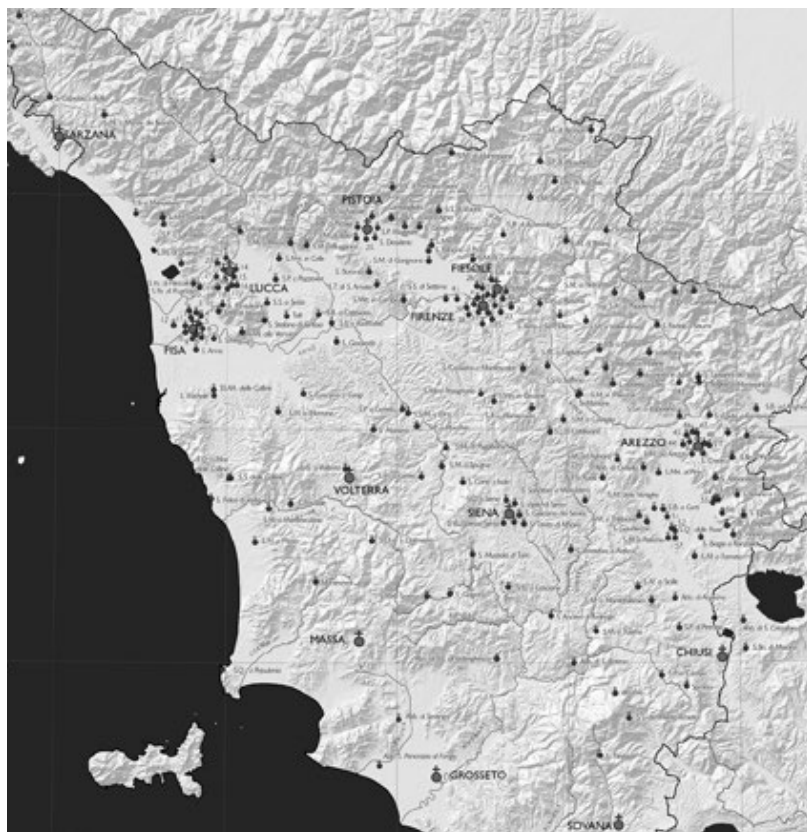
Figura 1. La distribuzione degli Enti monastici in Toscana fra 1295 e 1304.

Un altro dato che emerge a livello qualitativo - ovvero senza bisogno di andare a scomodare le formule analitiche della geografia quantitativa - è come la rete dei monasteri andasse ad occupare l'intero arco appenninico. Di 223 luoghi, qualcosa come più di 150 siti si trovano nell'arco settentrionale tra Luni e Chiusi.