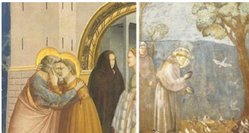
Giotto, Incontro di Gioacchino e Anna alla Porta Aurea (1303-1305 circa), Padova, Cappella degli Scrovegni.

La ricchezza culturale del periodo deve la sua grandezza anche agli occhi attenti dello spettatore. Gli artisti consapevoli dell'epoca di cambiamento che stavano vivendo, riscoprono nel loro lavoro la forza di essere comunicatori e diffusori di una società aperta nei confronti della realtà e del mondo intorno. Ciò si riconosce nei gesti descritti, nei luoghi dettagliatamente ritratti e nelle rappresentazioni fisiche e spirituali che trasmettono una vera e propria scoperta emotiva. L'uomo racconta emozioni che coinvolgono e testimoniano quotidianità e spiritualità. Le mani di San Francesco che offrono cibo agli uccelli, il dono del mantello al povero o la dolcezza del bacio fra Gioacchino e Anna (il primo bacio ad essere rappresentato nella storia dell'arte) avvicinano il fedele alla vita reale: le immagini hanno una prospettiva religiosa che segue il pensiero francescano e i gesti vengono rappresentati nella terra, lì dove sono avvenuti. Scompare il fondo d'oro, il cielo acquista il suo colore naturale, e anche il paesaggio viene mostrato in tutta la sua concretezza.