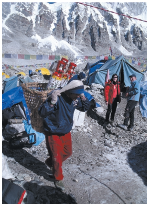
E finalmente le bombole arrivarono al Campo Base ...

I primi giorni di permanenza al Campo Base trascorrevano all'insegna dell'attesa, mentre gli altri colleghi iniziavano già i loro esperimenti, facendoci sentire le "pecore nere" del gruppo. È stato allora che, per ingrziarci le divinità di queste sacre montagne, come consuetudine prima di ogni ascensione alle vette, abbiamo ritenuto opportuno partecipare anche noi ad una puja di ringraziamento tenuta da un lama locale: affianco a corde, ramponi e piccozze in attesa della ben augurante benedizione, spiccavano in primo piano anche il nostro analizzatore ed un boccaglio.