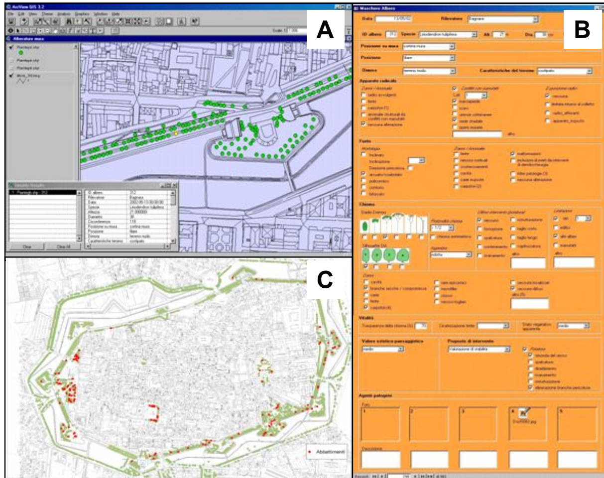
Fig. 1 - Sistema Informativo delle Alberature. (A) Software ArcView GIS 3.2 in cui viene mostrata l'individuazione di ogni singola pianta (punti colorati) su base cartografica (Carta Tecnica del Comune di Lucca, 1:1000); (B) Esempio di scheda anagrafica compilata per ciascun esemplare; (C) piante soggette ad abbattimento (classe 3) lungo le mura e nel centro storico.

so responsabile di rovinose cadute di grosse branche. Gran parte delle piante con carie richiedeva un tempestivo intervento (classe 3) per la messa in sicurezza, così come gli esemplari colpiti da Ceratocystis platani (= C. fimbriata f.s. platani ), agente del cancro colorato del platano, che sono stati immediatamente segnalati per l'abbattimento in ottemperanza della normativa vigente.