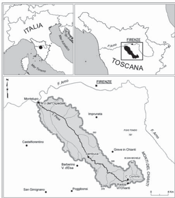
Figura 1. Localizzazione dell'area di studio e bacino del fiume Pesa.

A causa del suo andamento veloce di tipo torrentizio, il tratto montano della Pesa, presenta una bassa ritenzione dei nutrienti e una bassa attività biologica. Superata la zona industriale della Sambuca, il fiume presenta un alveo piuttosto ampio e pianeggiante, che favorisce il deposito di materiali inerti alluvionali, dando origine a tratti materassati filtranti, attraverso i quali le acque superficiali tendono a scomparire. In particolare durante la stagione secca, nella parte bassa del corso d'acqua, a partire dalla Sambuca, solo alcuni tratti di ristagno di acqua rimangono in superficie (AA. VV., 1997).